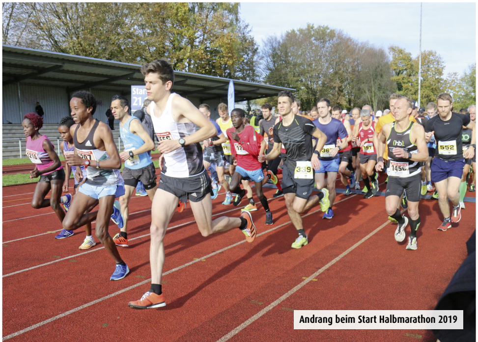
Andrang beim Start Halbmarathon 2019